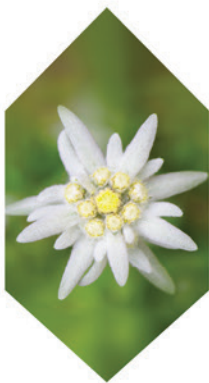
雪绒花愈伤组织培养物