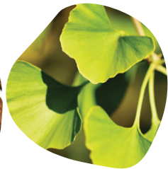
银杏叶 (叶) 提取物